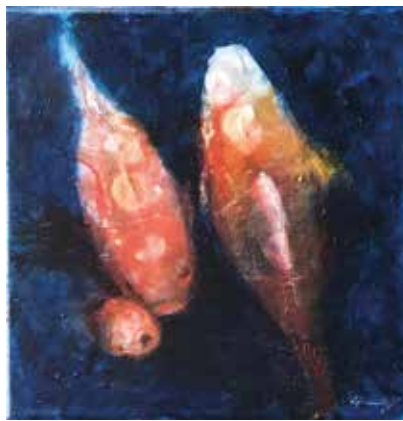
Malerei, Grafik, Fotografie, Skulptur

Die Abbildungen wurden von den Künstlerinnen geliefert; das Copyright liegt bei ihnen.