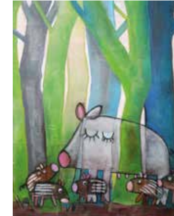
Malerei (Acryl, Wachs, Öl)

Ich präsentiere Ihnen Holzschnitte und CUT´s, Objektkunst aus Karton, und gebe Einblicke in Entstehungsabläufe. Schauen Sie mir über die Schulter beim Drucken. Das Wechselspiel zwischen Form und Farbe im Druck sowie auch bei meinen CUT´s lädt Sie ein zum Dialog.