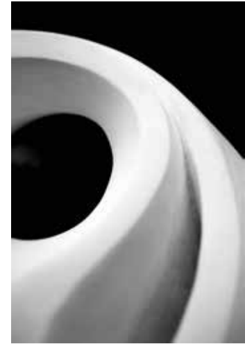
Bildhauerei, Skulpturen und Objekte

Mein Atelier kressart – idyllisch gelegen in Park- und Seenähe – dient mir seit fast 10 Jahren als Kraftort für Kreativität und Kunst. Hier können sich Besucher in vier Räumen einen Einblick in verschiedene Phasen meines Schaffens verschaffen. Stöbern Sie in Skizzenbüchern und Mappen. Ich freue mich auf Fragen und Gespräche – begleitet von einer kleinen Erfrischung.