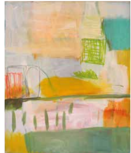
Mischtechnik: Pigmente auf Acrylbasis, Kreiden, Acrylstifte, Filzstifte auf Leinwand oder Papier

Bitte einfach 30 m weiter fahren und am Wald parken.