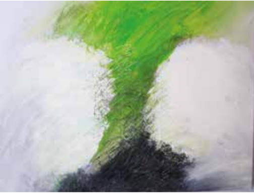
Malerie, Zeichnungen, Plastiken

„Kleines Haus – Kleines Atelier – Kleiner Garten“: Ich finde, aus allem kann man etwas machen, wenn man will. Und ich wollte meine Freude an der Malerei ausleben ebenso wie meine Begeisterung im Garten, im Gestalten, im Staunen. Die Besucherin, den Besucher erwartet im Atelier neben Acrylbildern auch Wachs-techniken, Radierungen und Collagen. Ein breites Spektrum aus 15 Jahren Experiment und dazu gemütliche Gartenplätze.