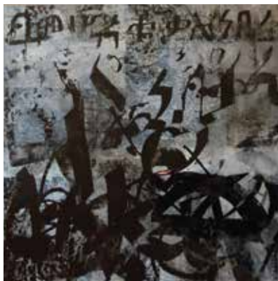
Mischtechniken, experimentelle Malerei

Zu sehen und entdecken gibt es Bilder, Collagen, kleine Objekte. Malerei und Zeichnungen auf Papier, z. B. Serien von Aktzeichnungen sowie Holzschnitte und andere Drucke. Kleine Figuren aus Draht, Postkarten und vieles mehr... Meine Themen sind oft Personen, ihr Sein, ihre Stimmungen, etwas Erzählerisches. Ich zeichne sehr gerne Menschen und Pflanzen, und versuche sie auf meine Art zu erfassen. In meinem Atelier biete ich Malen an, gerne können Sie sich über meine Kurse und Zeiten informieren. Ich freue mich auf Ihren Besuch.