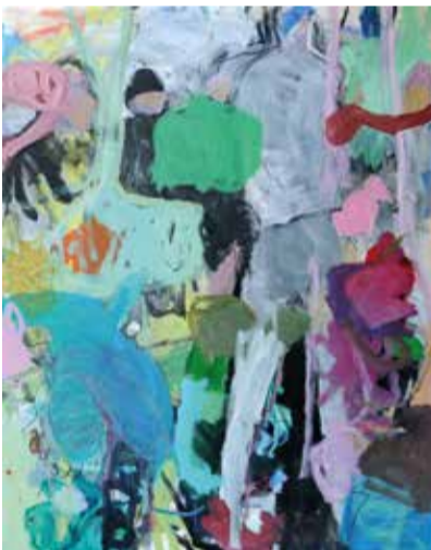
Acryl auf Leinwand

Ich arbeite an vielem gleichzeitig, mit unterschiedlichsten Materialien. Schmal und breit, Linie und Farbe, zart und heftig. Ich freue mich auf zahlreiche Besucherinnen und Besucher, die neugierig in meinem kleinen Atelier vorbeischaun und mit mir ins Gespräch kommen. Bei schönem Wetter gibt es gemütliche Terrassenplätze mit Aussicht.