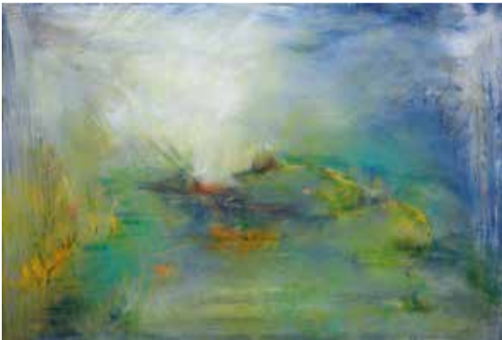
Mischtechnik, Druckgrafik, Acryl, Arbeit auf & mit Papier

Mein Atelier ist ein ehemaliges möbliertes Appartement, in Multifunktion als Atelier, Werkstatt, Gästezimmer. Ich zeige es in dem Zustand, in dem ich male. Ich bleibe so lange bei einem Thema, wie es mich fesselt. Die Bilder wachsen und verändern sich prozesshaft, wobei ich sie in verschiedenen Materialien angehe: kleinformig auf Papier oder Pappe; mit Acryl, Kohle, Tusche, Asche und Wachs; hergestellt mit oft selbst hergestellten Werkzeugen. Es ist der experimentelle Malprozess, der mich beim Schichten, Kratzen, Kleben, Überdrucken, Übermalen, beim Aufbauen und Zerstören inspiriert.