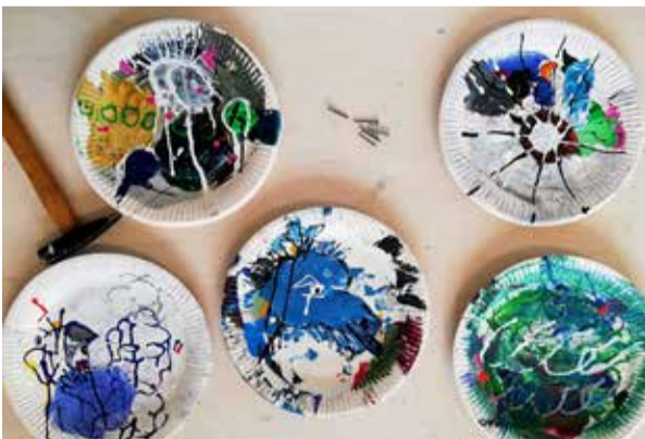
Malerie, Objekte, Plastiken