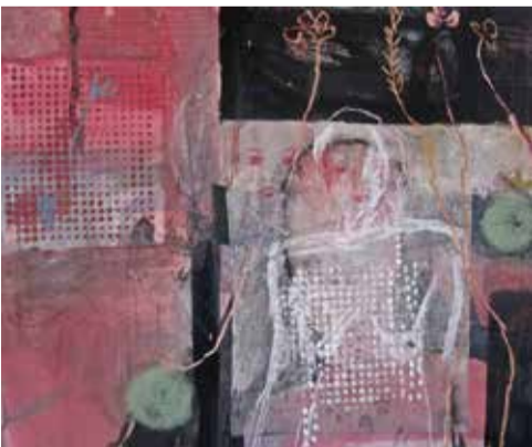
Malerie, Zeichnung, Druckgrafik, Holzschnitt

Zwischen Bäckerei Ulmer und Mode Frischmut in den Hinterhof.