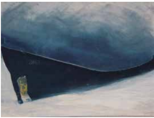
Mischtechniken, Acryl, Collage, Radierung, Draht/Papierskulptur